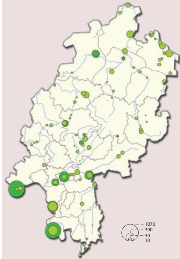
Lage und Größe der Kormoranschlagplätze in Hessen im Januar 1996 (dunkelgrün) sowie das Mittel der Januarzählungen 2008/10 (hellgrün). Insgesamt weniger Kormorane verteilen sich auf deutlich mehrere, aber kleinere Schlafplätze.

Dabei lohnt durchaus auch ein Blick auf die Erfolge der Sportfischer. Er lehrt uns, die Verzagttheit unserer eigenen Öffentlichkeitsarbeit zu